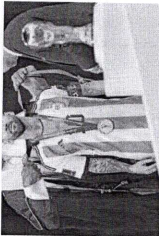
O Emir Sheikh Tamim bin Hamad al-Thani envolve um bisht em torno de Messi